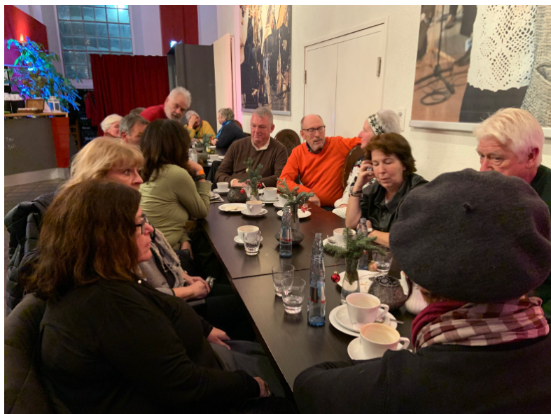
Nach dem Besuch des Von-der-Heydt-Museums (Dez. 22)

gen. Wir haben bei manchen Veranstaltungen Probleme. Wir mussten jetzt etwas, das wir geplant hatten, wieder absagen, weil sich nicht genug angemeldet haben. Es ist kein Selbstläufer, dass es wieder sofort losgeht.