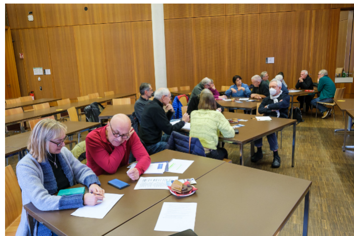
„Runder Tisch“ Dezember 2022