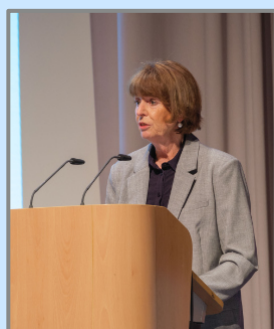
Oberbürgermeisterin Henriette Reker