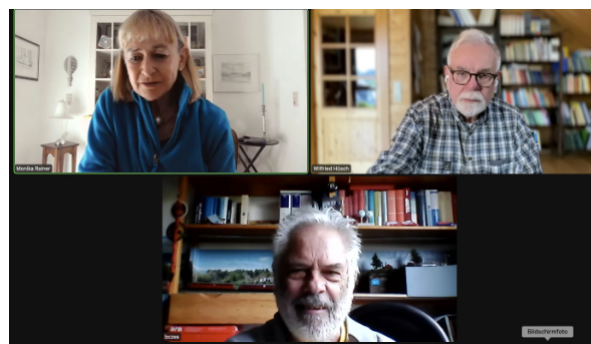
Interview über Zoom am 22.05.2023