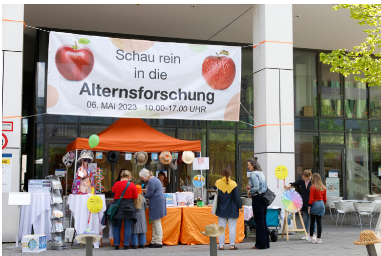
Tag der offenen Tür MPI-Age & CECAD. Köln, 06. Mai 2023

„Es ist fast so, als sei die Fliege gemacht, um den Forschenden zu helfen. Denn: Fruchtfliege und Menschen teilen sich etwa 60 Prozent ihrer Gene, 77 Prozent der bekannten Gene für menschliche Erkrankungen haben ein Pendant in der Fliege. Vor langer, langer Zeit hat es einmal einen gemeinsamen Vorfahren gegeben. Wie der aussah, was er war, ist unklar – aber die Ähnlichkeit bleibt. Es gibt Fliegen, die unter Schlaflosigkeit leiden, Alkoholismus kann auftreten und