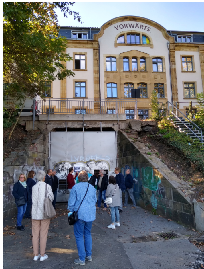
Führung für vfsa-Mitglieder durch die Konsumgenossenschaft „Vorwärts“